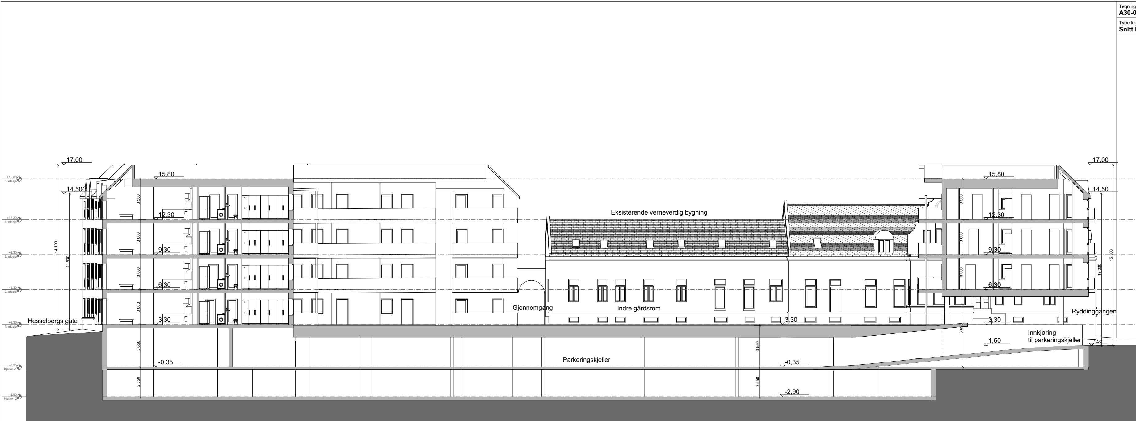
1:200 Snitt B